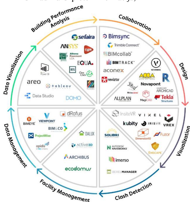
Slika 5. Mapa BIM softvera sortiranih prema glavnoj namjeni [4]

Implementacija industrijalizacije u kompanijama na razne načine optimizuje svakodnevni rad i procese građevinskog projekta. Samo jedan od brojnih primjera jeste uvođenje standardizacije elemenata zarad lakšeg projektovanja, bržeg izvođenja i smanjenja grešaka. U „biblioteci“ većine softvera postoje i gotovi standardni elementi kao što su konstrukcija stepeništa, grede, vrata, prozori, sklop armature, čelični profili, termoizolacija, opekarski proizvodi itd. Oni mogu biti ubačeni u projekat samo jednim klikom, što znatno ubrzava proces projektovanja naspram tradicionalnog načina.