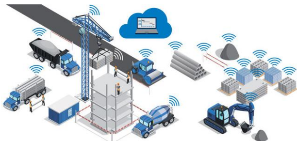
Slika 1. Digitalizacija gradilišta [1]

obrađuju elektronske podatke. Ako bi se pregledao koncept Industrijske revolucije 4.0 u građevinskoj industriji u poslednjih pet godina, može se uočiti aktivna saradnja između BIM-a sa tehnologijama iz industrije 4.0, ali takođe i njihov sam napredak (vještačka inteligencija, mašinsko učenje, robotika, 3D štampanje i druge), slika 1.