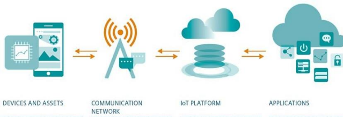
Slika 2. Hronološko osmišljavanje primjene Internet of Things [2]

U građevinarstvu, IoT može da pomogne u rešavanju brojnih problema. Na primjer, zahvaljujući raznim sensorima na gradilištu, upravljanje projektima postaje efikasnije a proces izgradnje postaje sigurniji i optimizovaniji. Senzori prikupljaju podatke na gradilištu, zatim se obrađuju softverom i daju menadžeru projekta potpunu sliku radne situacije. Ova tehnologija pomaže u kontroli velikih projekata, smanjujući vrijeme i troškove nadgledanja zadataka. Podaci se prikupljaju automatski i daje se sažetak, a informacije jasno pokazuju kada je potrebno preventivno održavanje, zamjena ili popravke, slika 2.