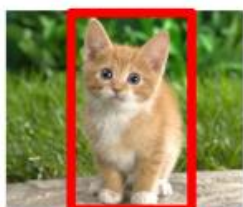
SLIKA 3. PRIMER LOKALIZACIJE OBJEKTA

Detekcija objekata kombinuje ova dva algoritma, na način da lokalizaciju koristi za lociranje i iscertavanje graničnog okvira oko svakog objekta od interesa na fotografiji i svakom od njih dodeljuje oznaku klase, tako da koristi algoritam klasifikacije [6].