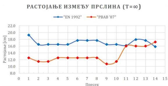
Slika 3. Rastojanje između prslina

Kao što se sa grafikona na slici 3 može zapaziti, dobijaju se različite vrednosti rastojanja između prslina primenom EN i SRB standarda. Iz izraza po kojima se dolazi do razmaka između prslina prema oba standarda zapaža se da se oni sastoje iz dva sabirka, gde u prvom učestvuje zaštitni sloj betona sa određenim koeficijentima, a u drugom vrsta armature, vrsta napreznjanja, prečnik podužne armature i koeficijent armiranja efektivne zategnute zone. Sama razlika se može opravdati različitim prečnicima šipki i različitim koeficijentima armiranja koji su usvojeni u ovim standardima.