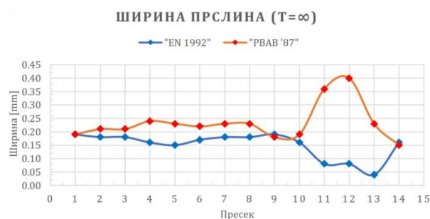
Slika 4. Širina prslina

Karakteristične širine prslina se, takođe, razlikuju, s tim da su kod greda razlike znatno manje nego kod stubova. Kada se uporede izrazi dati u dva standarda, vidi se da se prema EN propisima širina dobija kao proizvod maksimalnog razmaka između prslina i razlike srednjih dilatacija u armaturi i betonu, a prema SRB se ona definiše kao vrednost koja je 70% veća od proizvoda srednjeg rastojanja prslina i razlike dilatacija u armaturi i betonu. Uporedni prikaz vrednosti širina prslina je dat na slici 4.