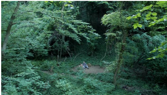
Slika 3. Prostor izvođenja plesnog performansa