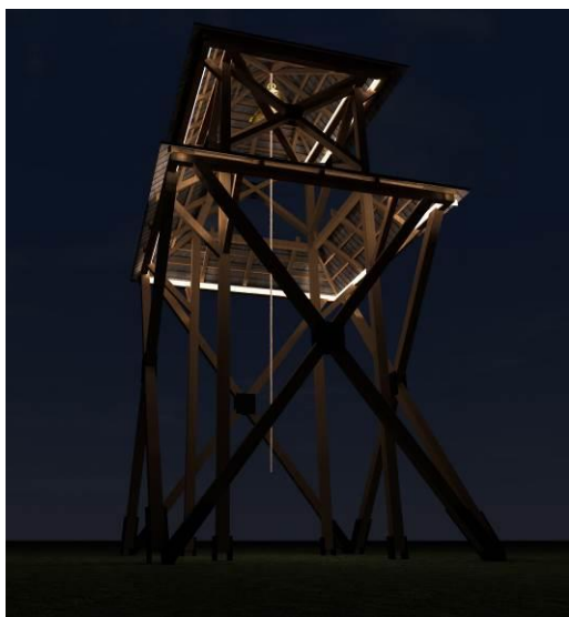
Графички прилог 3. Ноћни рендер трећег модела

Конструкција овог модела се састоји од четири стуба која су постављена у облику квадрата у основи. Они се простиру целом висином конструкције и представљају њену окосницу. Стубови пролазе кроз прву кровну раван за коју су везани косницима са по две стране и продужавају се до друге кровне равни за коју имају улогу ослонца. Горњи део стубова, који је изнад првог крова, спрегнут је са све четири стране унакрсним спреговима који су причвршћени челичним плочама са обе стране спрегова.