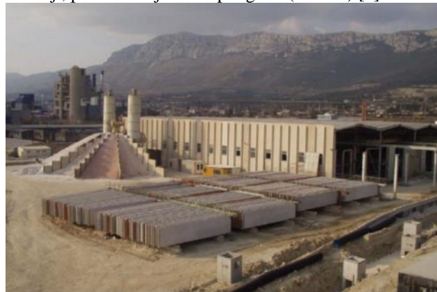
Slika 6. Proizvodni pogon spolja iz [3].

Objekat hale koja je predmet ove analize rađena je metodom prefabrikacije betonskih elemenata na nepokretnim kalupima koji omogućavaju izradu svih vrsta elemenata. Ceo proizvodni proces od pripreme kalupa i postavljanja armature, preko betoniranja i ubranog očvršćavanja, odvija se na jednom radnom mestu, na lokaciji, proizvodnoj hali ili poligonu (slika 6.) [1].