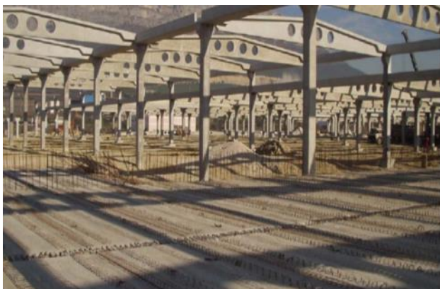
Slika 2. Izgled skeletnog sistema [3].

Skeletni sistem od pojedinačnih elemenata ima prednost u odnosu na ramovski sistem zbog jednostavnijeg tehnološkog procesa i opreme, lakšeg transporta i montaže. Objekat hale izgrađen je u podužnom sklopu gde se gredni nosači pružaju paralelno sa podužnom osom objekta (slika 2.).