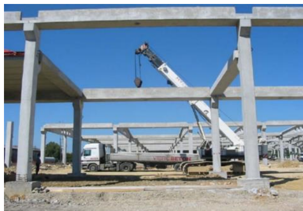
Slika 7. Samohodna dizalica [3].

Ovakvim načinom montaže mogu se montirati samo laki elementi dizalicama koje pri radu ne koriste stabilizatore (slika 7.) [1].