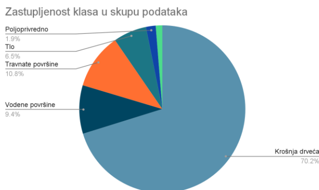
Slika 1. Zastupljenost klasa u skupu podataka

Trening skup je sačinjen od 80% ukupnog uzoračkog skupa, a test skup predstavlja preostalih 20% podataka. Slika koja se obrađuje je slika iz Sentinel-2 putanje R036 sa oznakom T34TCR.