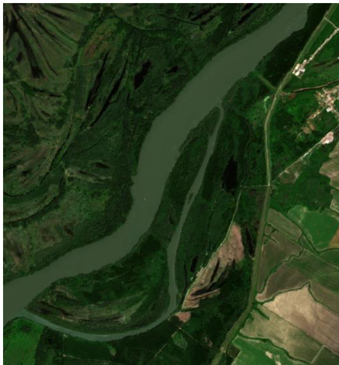
Slika 2. Izgled Gornje Podunavlja Sentinel-2 slike

Ovi indeksi su odabrani na osnovu problema koji se rešava i povezanosti između prediktovanih klasa i ovih obeležja.