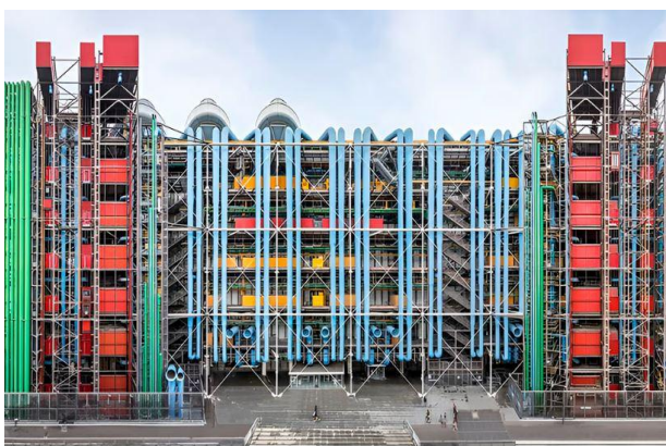
Слика 3. Фасада културног центра Жорж Помпиду

флексибилност и дугорочна одрживост: Једна од најважнијих особина Центра Жорж Помпиду је флексибилност простора, која омогућава прилагођавање различитим типовима програма и потребама корисника. Галерије и изложбени простори могу се трансформисати за различите врсте изложби, перформанси или јавних догађаја, док библиотеке и образовни центри обезбеђују континуитет учења и стручног развоја. Ова способност адаптације, у комбинацији са јасно дефинисаним функцијама и интеграцијом јавних зона, осигурава дугорочну релевантност објекта као културног и социјалног центра, чинећи га примером успешне мешовите намене у савременој архитектури.