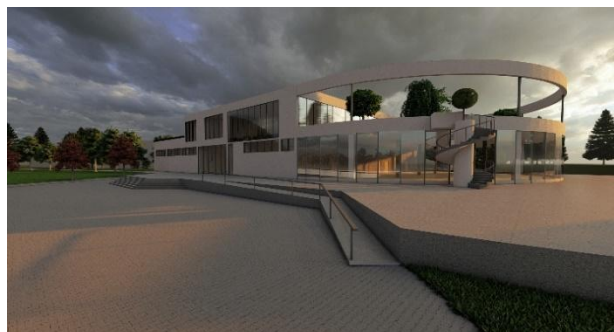
Слика 7. 3Д приказ објекта

фасада појачава утисак просторне повезаности и интеракције са околином.