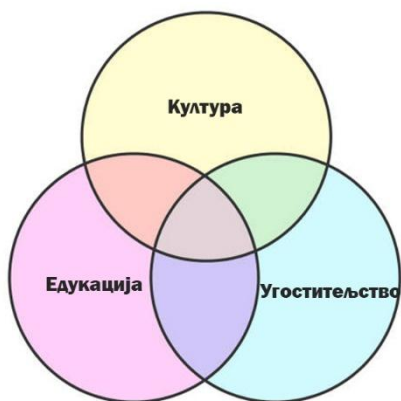
Слика 1. Приказ мешовитости намена