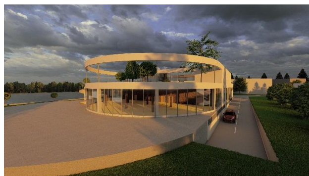
Слика 8. 3Д приказ објекта