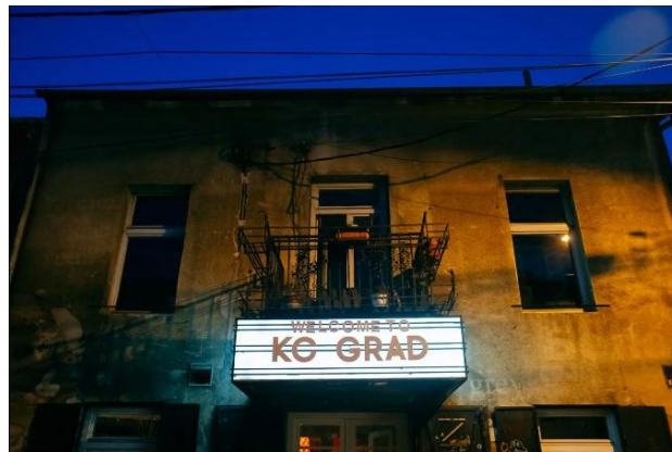
Слика 2. Фасада културног центра КЦ Град

која омогућава прилагођавање програма променљивим потребама корисника. Простори се могу трансформисати за различите врсте догађаја, од изложби и предавања до позоришних представа и радионица. Ова адаптивност, у комбинацији са елементима енергетске ефикасности и промишљеном организацијом простора, доприноси дугорочној функционалној и културној одрживости објекта, омогућавајући му да остане релевантан у савременом урбаном контексту.