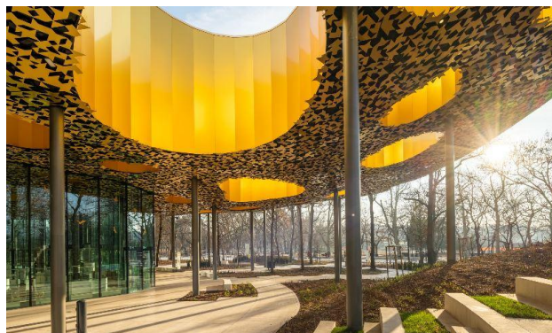
Слика 4. Надстрешница Куће Музике у Будимпешти

Флексибилност и дугорочна одрживост: Једна од кључних карактеристика House of Music је флексибилност простора, која омогућава прилагођавање различитим врстама културних и образовних програма. Концертне и изложбене сале могу се трансформисати за различите догађаје, док учионице и радионице обезбеђују континуитет образовног програма. Адаптивност простора у комбинацији са пажљиво дефинисаним јавним зонама доприноси дугорочној функционалној и културној релевантности објекта, чинећи га примером објекта мешовите намене који успешно интегрише културу, образовање и друштвене активности.