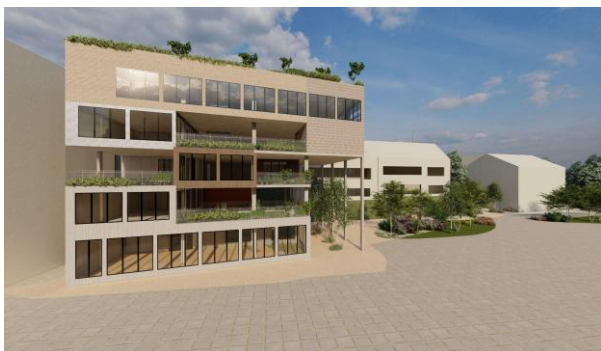
Слика 5. Просторни приказ северне фасаде нове читаонице

Паметна зелена коцка је „склапање“ простора са одређеном програмском организацијом у једну целину од културног значаја која треба да слави креативност, разноликост и образовање. Затим отворити и разложити коцку тако да се виде сегменти између којих продира зеленило потребно за већи угођај, природно осветљење и свеж ваздух.