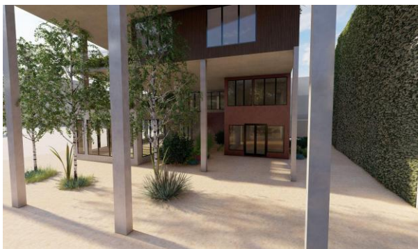
Слика 6. Просторни приказ улазног дела нове читаонице