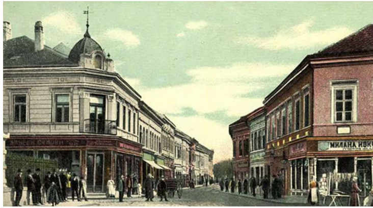
Слика 1. Дунавска улица број 1, 1906-1909 године [4]